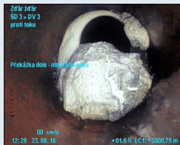
Foto: montážní pěna v kanalizaci

trvalo dohodnout se zhotovitelem akceptovatelnou cenu za realizaci kanalizace. V úvahu ještě připadlo několik dalších variant a) ponechat kanalizaci ve stávajícím stavu a doufat, že vydrží opravu komunikace, b) provést opravu nejhorších míst, c) odložit opravu komunikace a provést opravu kanalizace přes zimu a navázat v jarních měsících